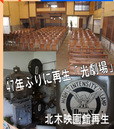
47年ぶりに再生「光劇場」 北木映画館再生